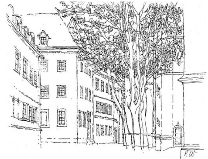
KURATORIUM ALTSTADT PIRNA E.V.